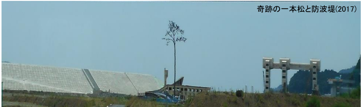
奇跡の一本松と防波堤(2017)

東日本大震災地訪問の4年間をふり振り返り、災害直後の応急処置について実習します。